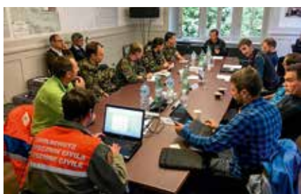
Gemeinsame Sprache bei der Ereignisbewältigung in Bondo: zivile und militärische Einsatzkräfte Hand in Hand mit den Fachspezialisten privater Unternehmen

Sowohl die Bündner Wirtschaft als auch die Schweizer Milizarmee benötigen gut ausgebildete Fachleute und Kader, um erfolgreich zu sein. Die Unternehmen stellen der Armee ihre Mitarbeitenden zur Verfügung, welche