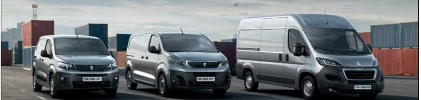
NEUER PEUGEOT PARTNER