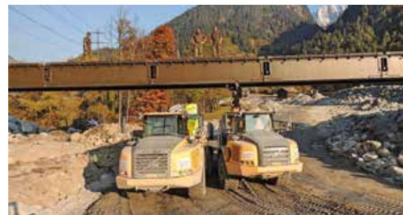
Armee und Baugewerbe ermöglichen der Bevölkerung Bondos nach 52 Tagen Evakuierung die Rückkehr in ihre Häuser

ihren Möglichkeiten und beruflichen Qualifikationen entsprechend ausgebildet und eingesetzt werden. Sie ermöglichen damit, dass die Armee jene Sicherheit schafft, die es für eine nachhaltige wirtschaftliche Entwicklung braucht. Im Gegenzug bietet die Armee zahlreiche Aus- und Weiterbildungen an, die von zivilen Arbeitgebern anerkannt werden. Die Armeeinghörigen können fachspezifische Ausbildungen beispielsweise in den Bereichen Erste Hilfe, Sprengen, Automobiliagnose, Fahrlicenzen, Gefahrguttransport, Küche oder Labors sowie hochstehende Führungsausbildungen absolvieren. Nirgendwo sonst wird jungen Menschen so früh so viel Führungsverantwortung übertragen. Die Schweizer Armee ist nach wie vor die wohl beste praktische Führungsschule des Landes. Soziale, fachliche und methodische Fähigkeiten werden gleichermaßen gefordert und gefördert, nicht nur in der Theorie, sondern – und vor allem – in der Praxis. Absolventinnen und Absolventen von Unteroffiziers- oder Offizierslehrgängen lernen früh, Lagen zu beurteilen, unter Zeit-