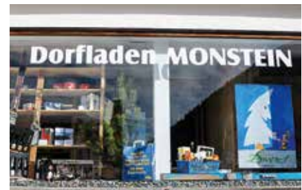
Auch im Dorfladen werden die Monsteiner Biere verkauft.

er in der Region Kästen aufgestellt, um das Leergut zurückzunehmen und wieder zu verwerten. Und auch auf das 20-jährige Jubiläum hin dürfte im Sommer das eine oder andere aus Monstein zu hören sein.