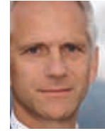
Tarzsius Caviezel Nationalrat Davos