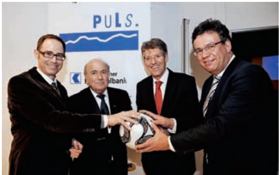
FIFA-Präsident Joseph S. Blatter, zusammen mit den Geschäftsführern der Dachorganisationen

Aus Sicht der Dachorganisationen muss Chur gezielt koordiniert und mit wertschöpfungsintensiven Betrieben wachsen. Dabei wird es für grosse, flächenintensive Betriebe oder solche mit Emissionen keinen Platz haben. Chur muss sich zum Dienstleistungszentrum für Dienstleistungsexperten entwickeln. Die Verdrängung der Unternehmen in den gemischten Zonen durch Wohnbauten ist zu stoppen. Derzeitige und künftige Landreserven aus dem ehemaligen Armeeareal sind für die nachhaltige wirtschaftliche Entwicklung verfügbar zu machen, respektive zu reservieren. Zur Erreichung des im gesamtwirtschaftlichen Interesse des Kantons notwendigen Wertschöpfungswachstums müssen gezielt eigentliche «Wirtschaftsmotoren» angesiedelt werden. Gesucht sind Betriebe mit hoher Wertschöpfung, saubere Betriebe mit wenig Landverschleiss, dank welchen eine eigentliche Wertschöpfungskette mit vor- und nachgelagerten Betrieben aufgebaut werden kann. Sodann soll sich Chur einerseits als Basisstation für den Tourismus entwickeln. Andererseits soll Chur zu einer Plattform für Dienstleistungen mit einer spezialisierten, wissensintensiven und platzsparenden Industrieproduktion werden, was auch aus touristischer Sicht zu Wertschöpfung führen wird. Mit der Positionierung der Stadt Chur als Einkaufsort und als ganzjähriger Marktplatz sowie mit der Investition in überregionale Attraktionen in den Bereichen Kultur und Sport können und dürfen die zur Zeit verfügbaren Hotelzimmer den Bedarf mittelfristig nicht