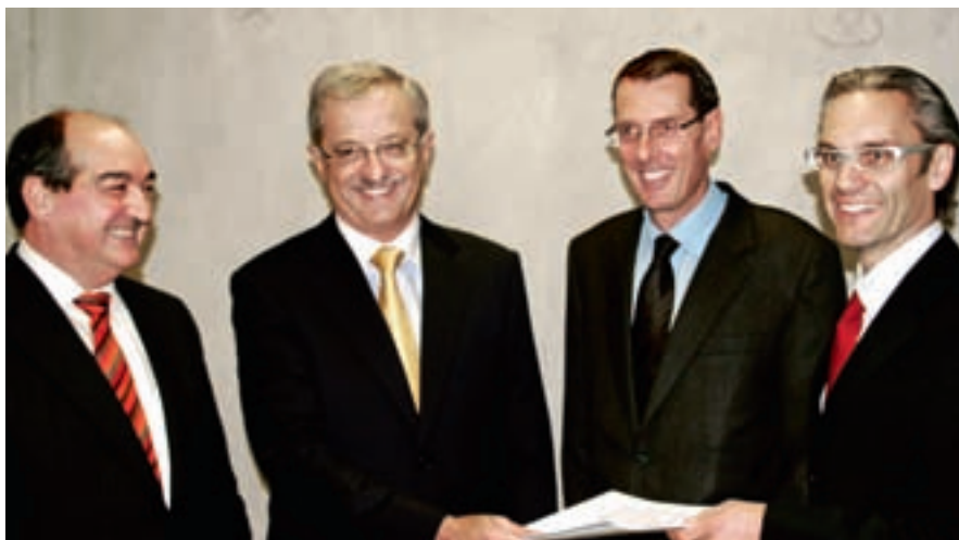
Die Präsidenten der Dachorganisationen übergeben Regierungsrat Hansjörg Trachsel das Wachstumspolitische Manifest an der GV der Handelskammer

Arbeitsplätze sicher zu stellen und genügend Leute anzuziehen. Um dieses hochgesteckte Ziel zu erreichen, muss die Politik attraktivere Rahmenbedingungen schaffen und eine Wirtschaftspolitik einleiten, die echte Impulse gibt. Im Wirtschaftspolitischen Manifest fordern die Dachorganisationen eine dreiteilige Wachstumsstrategie, die erstens auf der Erhöhung des finanziellen Spielraums der öffentlichen Hand besteht, zweitens auf einer Verbesserung der Standortvoraussetzungen und drittens auf der Durchführung gezielter Wachstumsinitiativen. Im Bereich der Erhöhung des finanziellen Spielraums müssen weitere mögliche Sparpotenziale ausgeschöpft und mögliche zusätzliche Finanzierungsquellen für den Staatshaushalt erschlossen werden. Im Manifest werden konkrete Beispiele aufgeführt. Die Verbesserung der Standort-