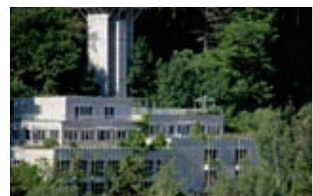
Impressionen von der Eröffnung des Hauses der Wirtschaft am 1. September 2008